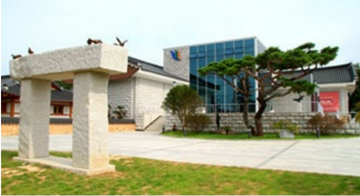
1코스 - 영암군립하정웅미술관