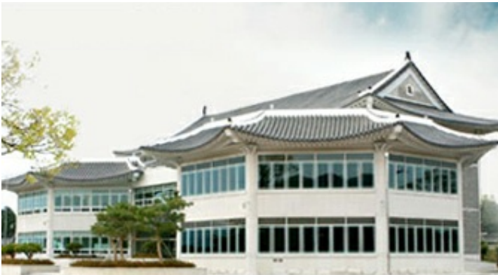
2코스 - 영암도기박물관