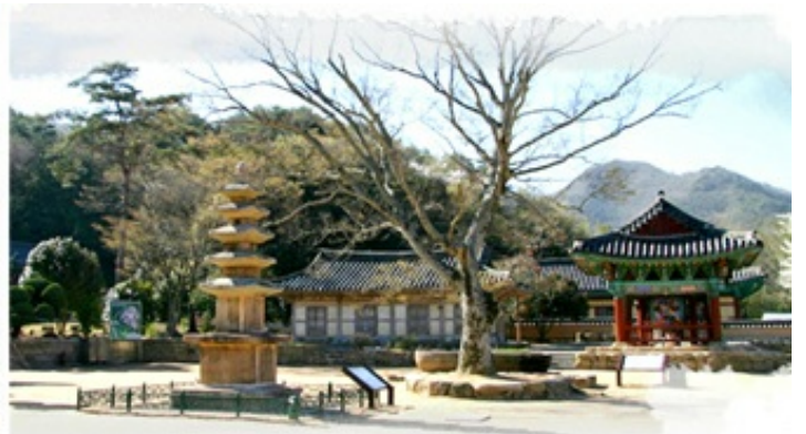
3코스 - 도갑사