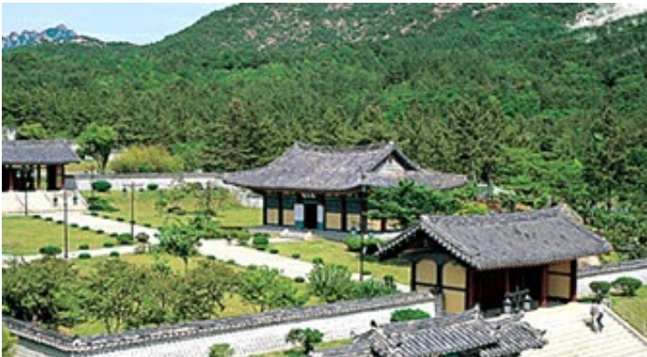
4코스 - 왕인박사유적지