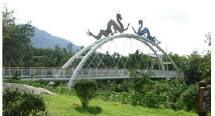
5코스 - 기찬랜드