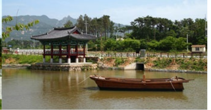
1코스 분기점 상대포역사공원