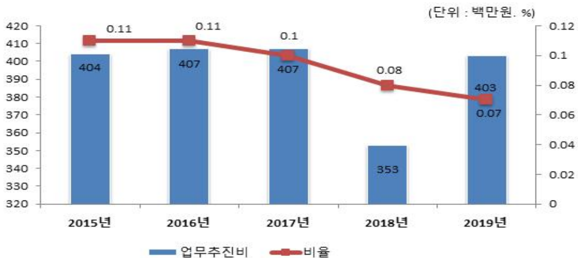
업무추진비 연도별 변화

☞ 우리군 결산액 대비 업무추진비 비율은 매년 지속적으로 감소하다 2019년에는 전년도인 2018년도와 같은 비율을 보이고 있으며 2019년 업무추진비는 전년 대비 50백만원이 증가한 403백만원을 지출하였습니다.