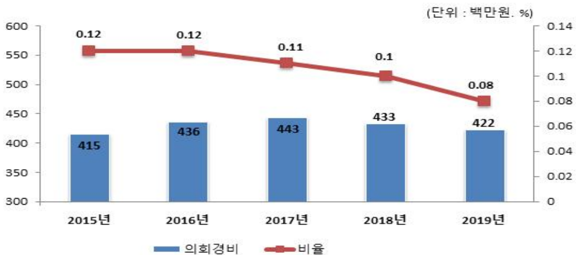
의회경비 연도별 집행액 및 비율 변화

☞ 우리 군 의회경비 비율은 2015년 0.12%p에서 매년 감소하고 있으며, 2019년에는 2018년 대비 0.02%p 감소한 0.08%p를 보이고 있습니다.